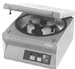
Centrifuga Rotofix 32A – nechlazená