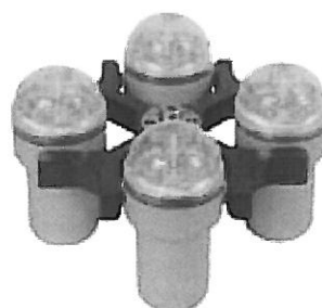
Rotor 1624 + závěsy 1481 ( bez proti aerosolových víček)